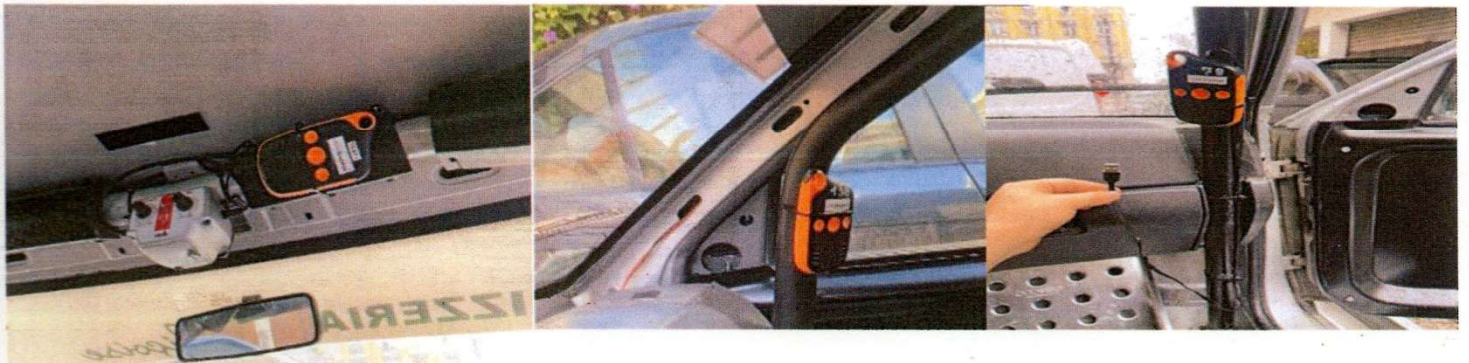
Câble Alimentation fourni par VDS 80 cm

ATTENTION prévoir suffisamment de longueur de câble pour avoir accès aux 2 emplacements obligatoires du boitier ou utiliser une rallonge USB